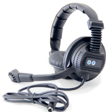
Sluchátka KDZ s regulací hlasitosti